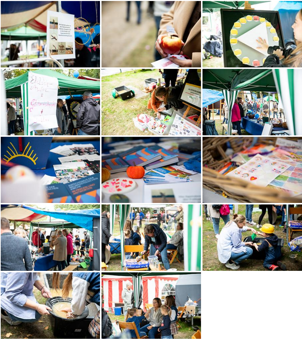
Den Glauben leben, Nächstenliebe üben – Begegnungsstand der Neuapostolischen Kirche auf dem Volksparkfest begeistert Besucher